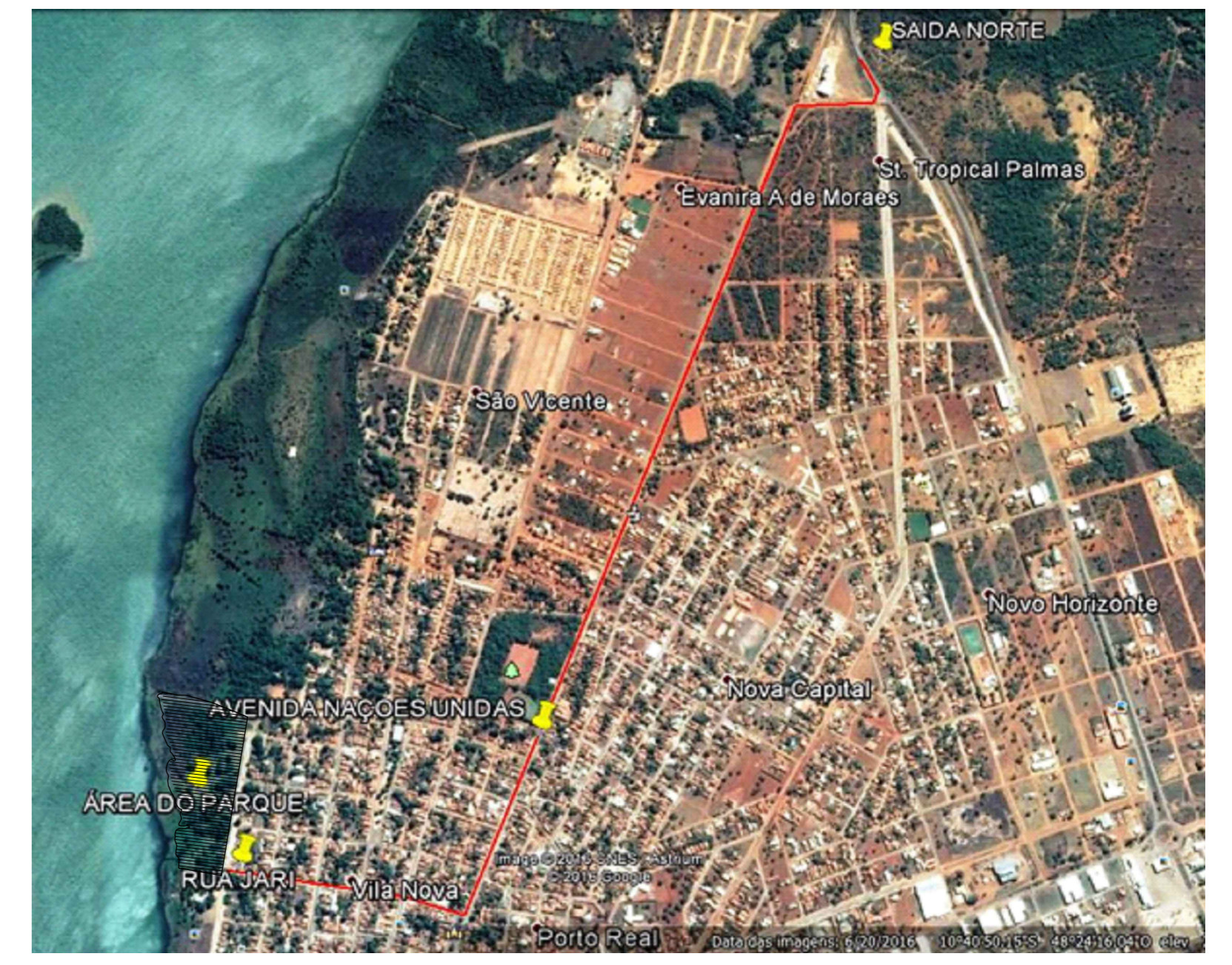
2 PLANTA DE SITUAÇÃO ESCALA 1/15000