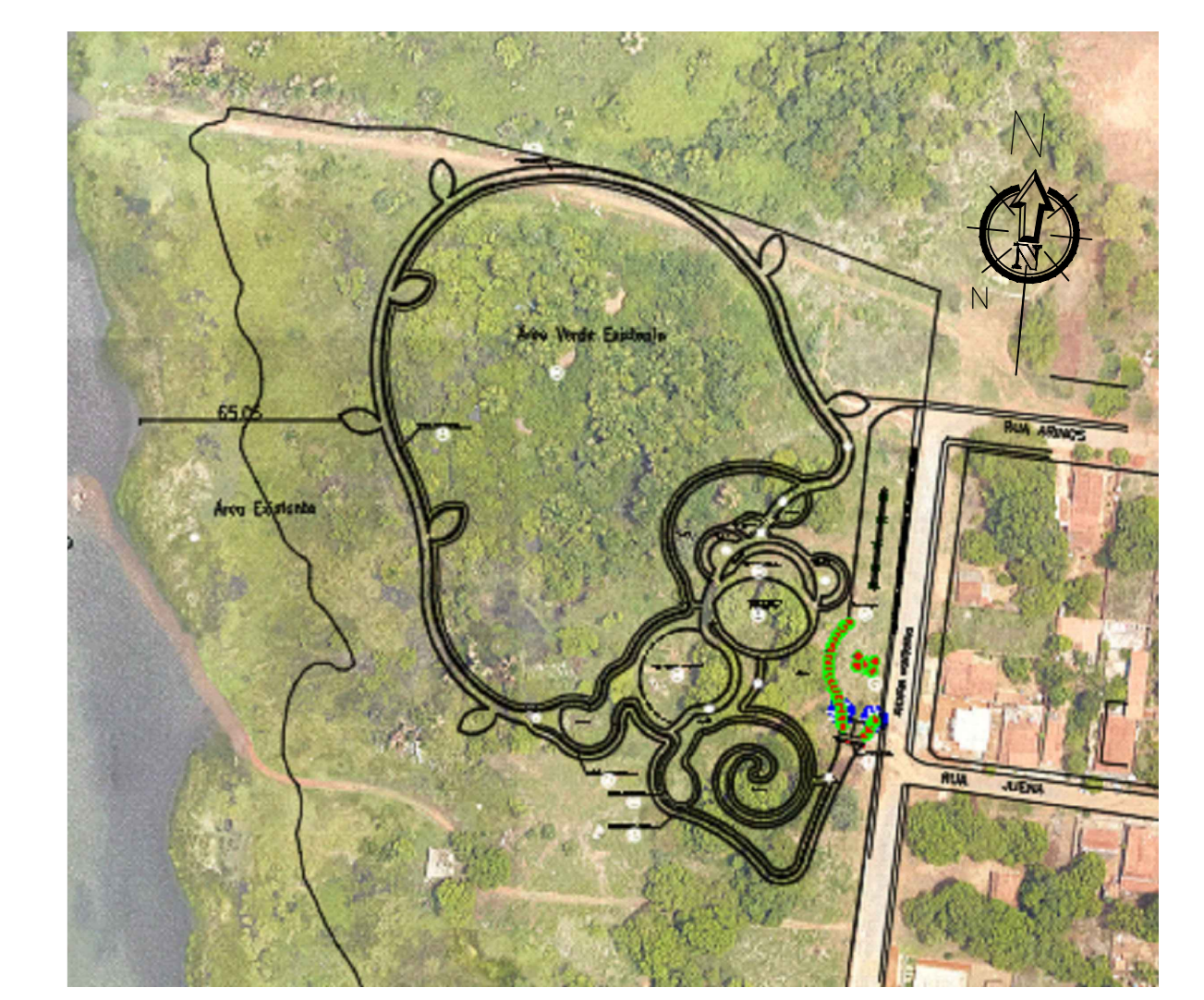
3 PLANTA DE LOCAÇÃO SEM ESCALA