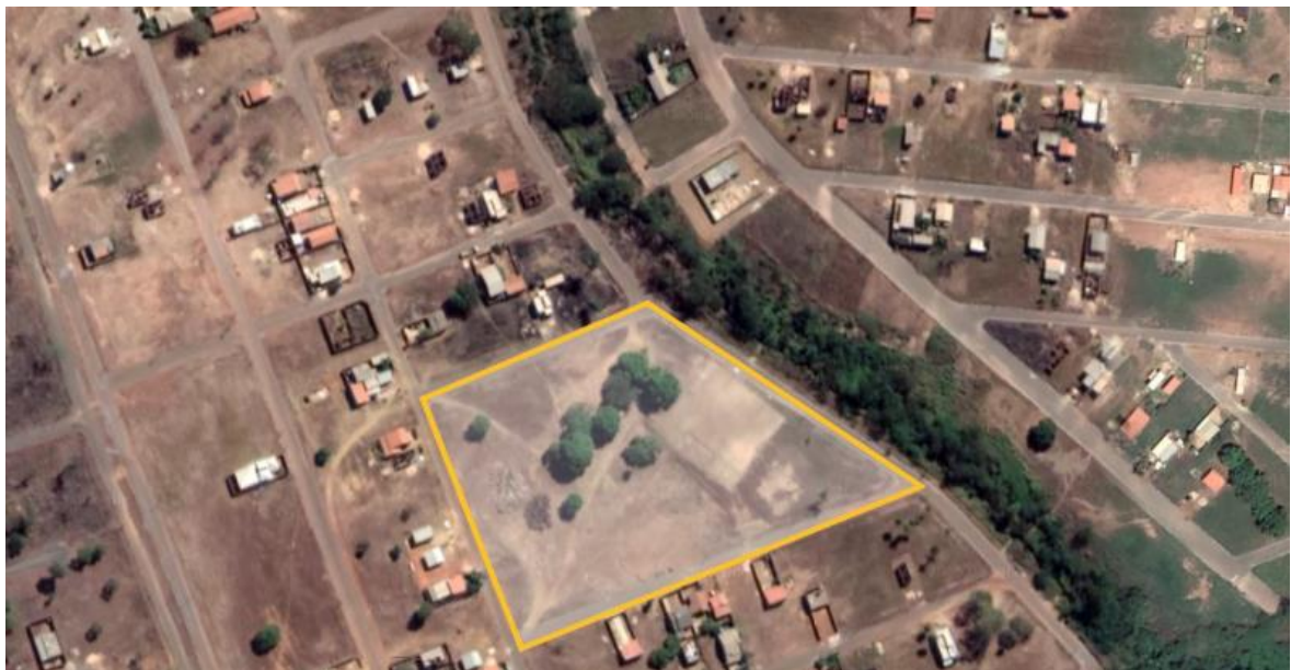
Figura 04: Praça Jardim Europa-Luzimangues