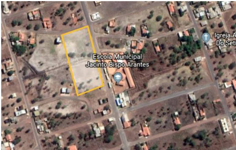
Figura 03: Imagens Retiradas do Google Earth – Praça Portal do Lago -Luzimangues