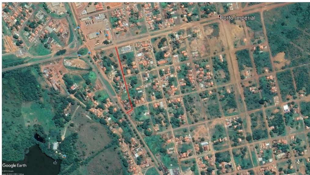
Figura 02: Imagens Retiradas do Google Earth – Marginal Entrada Sul.